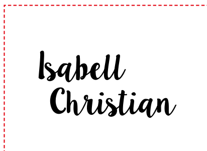
Exportierte Ebene zur Heißfolienprägung (hier in Gold)